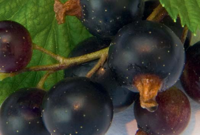
LE FOGLIE DI CASSIS sono in grado di favorire il benessere delle articolazioni.