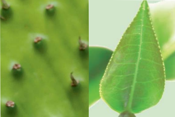
IL NOPAL E IL TÈ VERDE per drenare i liquidi corporei e favorire il transito intestinale.