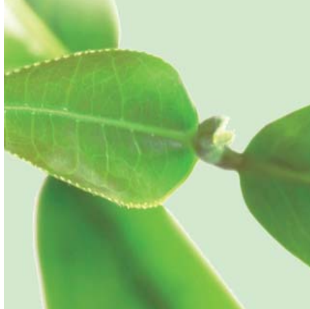
IL TÈ VERDE contribuisce a favorire l'equilibrio del peso corporeo.