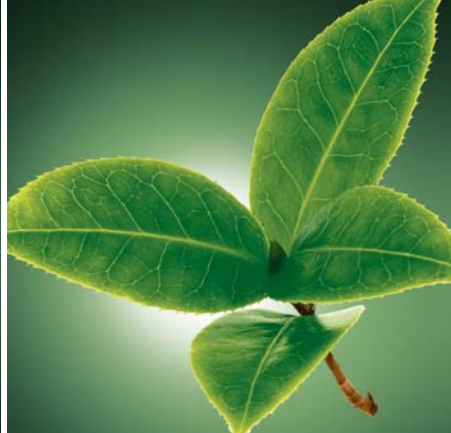
LE FOGLIE DI TÈ VERDE partecipano al drenaggio dei fluidi corporei.