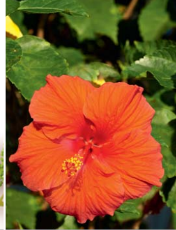
I FIORI DI IBISCO aiutano a dare sollievo.