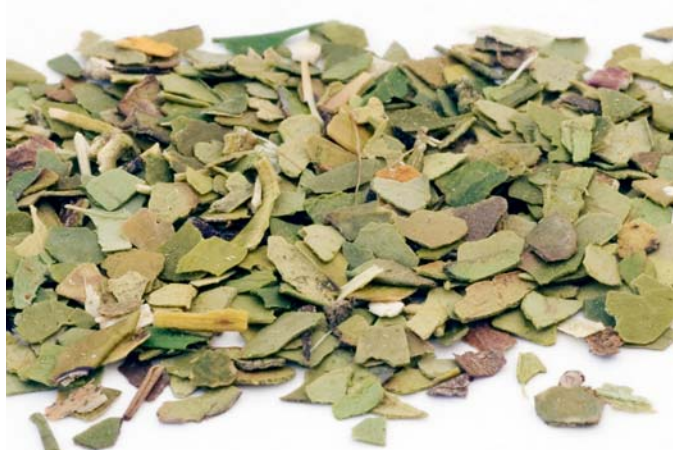
IL MATE contribuisce a favorire l'equilibrio del peso corporeo