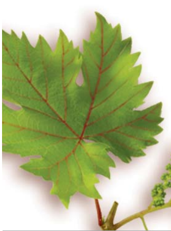
LA VITE ROSSA contiene nelle foglie dei tannini che favoriscono il trofismo del microcircolo.