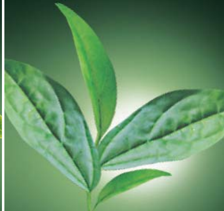
ERBA MATE aiuta a mantenere l'equilibrio del peso corporeo.