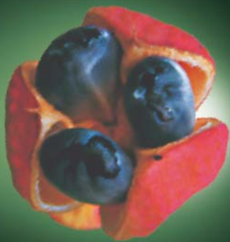
IL GUARANÀ i suoi semi favoriscono il metabolismo dei lipidi.