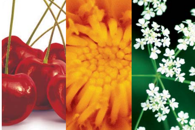
IL PICCIOLO DI CILIEGIA, IL DENTE DI LEONE E IL SAMBUCO per le proprietà drenanti.