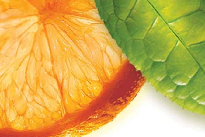
GLI ESTRATTI DI CITRUS AURANTIUM E DI TÈ VERDE favoriscono il metabolismo glucidico e lipidico.