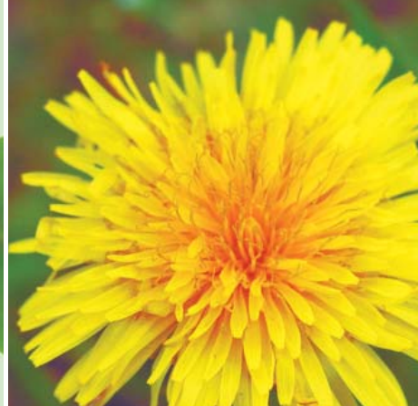
IL DENTE DI LEONE favorisce l'eliminazione dei liquidi in eccesso.