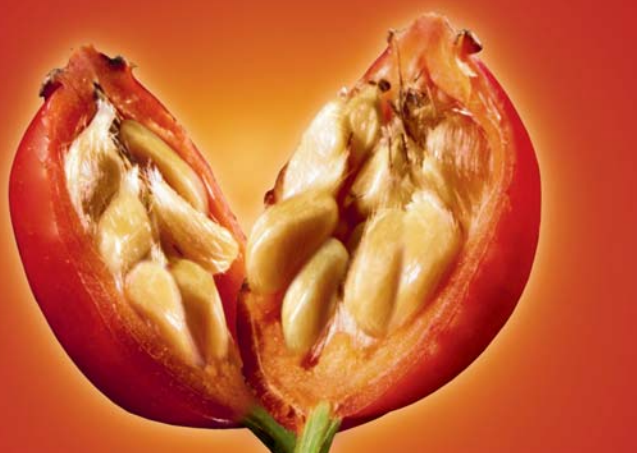
IL CINORRODO agisce dall'interno sulla sintesi del collagene.