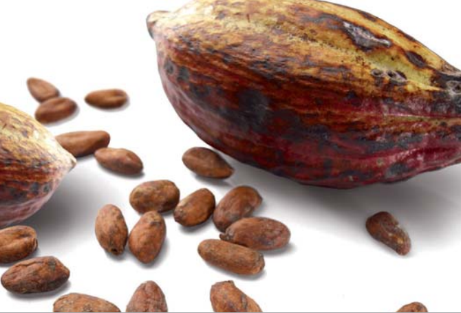
LA FAVA DI CACAO è il frutto dell'albero di cacao. Il suo estratto è ricco di Magnesio.