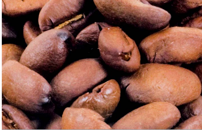
IL CAFFÈ 100% miscela Arabica associato ai chicchi di Caffè Verde per una bevanda dal gusto delicato.