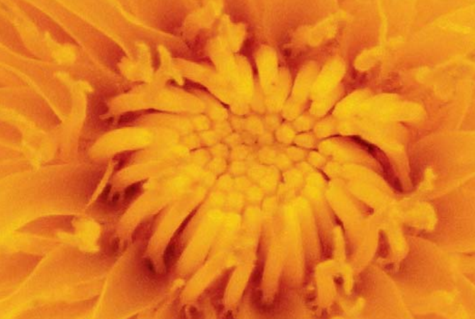
IL DENTE DI LEONE per le sue virtù detossinanti.