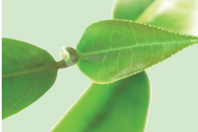
IL TÉ VERDE per le sue proprietà depurative.