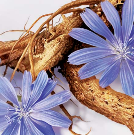
LA RADICE DI CICORIA contribuisce a purificare l'organismo.