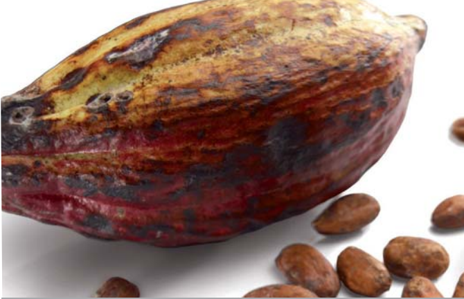
IL CACAO per la sua azione sul controllo del peso corporeo.