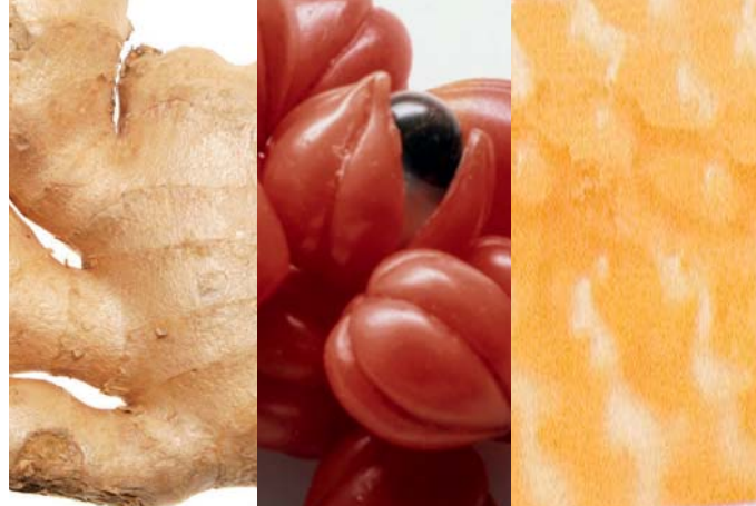
LO ZENZERO, IL GUARANÀ E LA PAPPA REALE contribuiscono a ridurre la stanchezza e attivare l'energia.